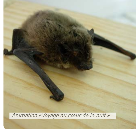
Animation «Voyage au cœur de la nuit »