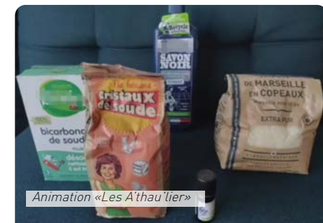
Animation «Les A'thau'lier»