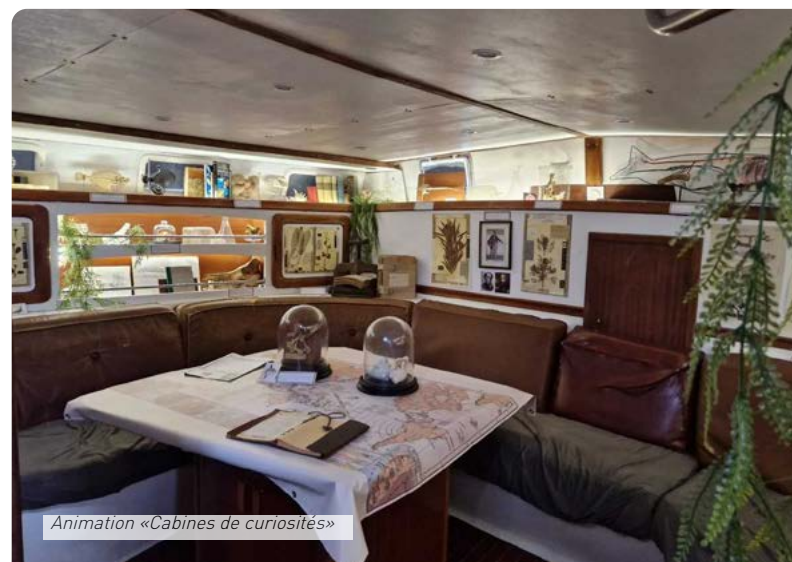
Animation «Cabines de curiosités»

RÉSERVATION : au 06 23 45 93 39 ou sur https://bit.ly/3Y2yXqN