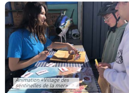
Animation «Village des sentinelles de la mer»